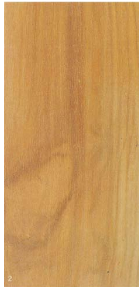
1 - Secrétaire en petit natte 2 - Echantillon