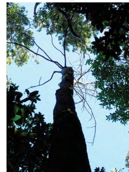
Mort rapide de l'arbre écorcé et traité