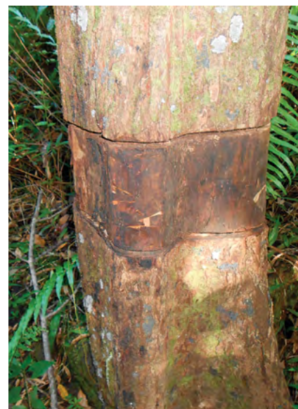
Annélation et application de phytocide