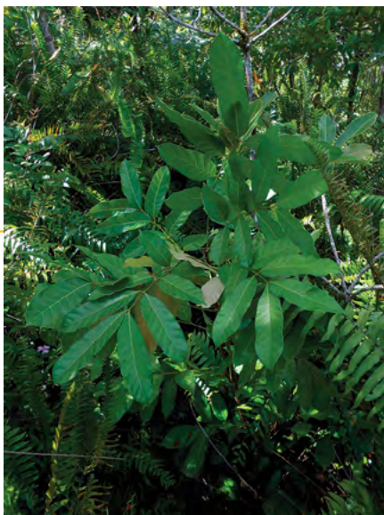
Rejet après coupe et traitement