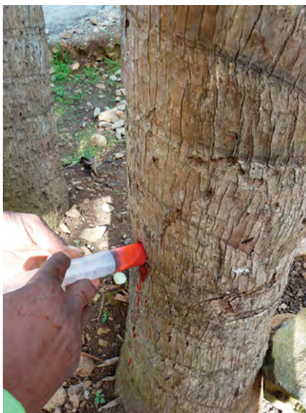
Injection de Triclopyr à la seringue

Le Ravenale ou Arbre du Voyageur est devenu très envahissant dans les deux autres îles de l'archipel des Mascareignes. Il forme à basse altitude, en particulier le long des ravines, des peuplements denses et monospécifiques. À La Réunion, il ne possède pas pour l'instant la même dynamique invasive mais dans certains secteurs de l'Est, il commence à se naturaliser.