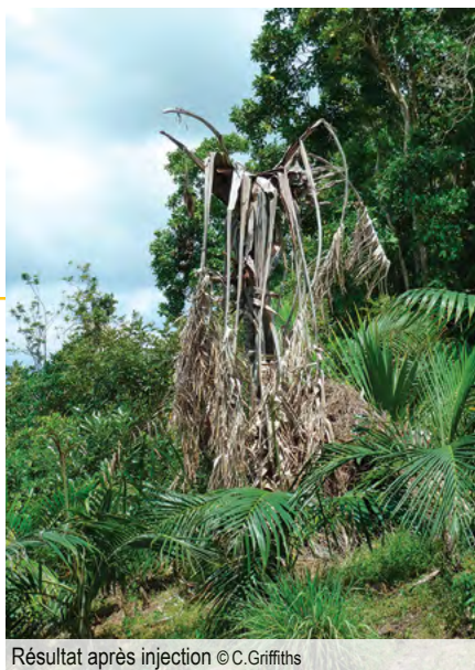
Résultat après injection