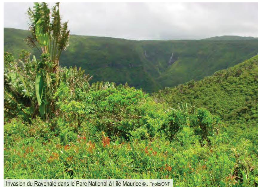
Invasion du Ravenale dans le Parc National à l'île Maurice