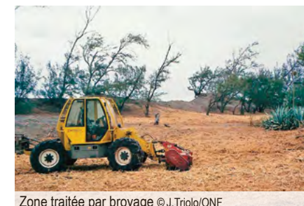
Zone traitée par broyage