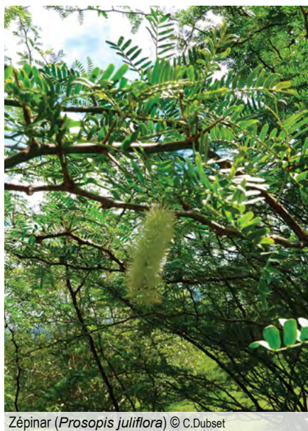
Zépinar ( Prosopis juliflora )

Arbuste ou petit arbre qui envahit la zone sèche de très basse altitude dans l'Ouest de l'île : zone littorale, bord d'étangs littoraux, savane... Espèce pionnière héliophile, qui a la capacité à former très rapidement des fourrés denses monospécifiques impénétrables. Cette espèce possède de longues épines, pouvant occasionner de sérieuses blessures.