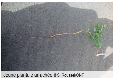
Jeune plantule arrachée