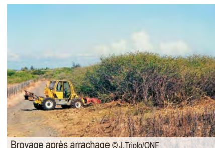
Broyage après arrachage