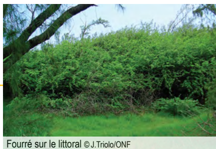
Fourré sur le littoral