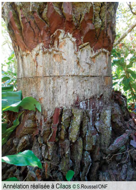
Annélation réalisée à Cilaos

Le pin maritime est devenu envahissant dans le cirque de Cilaos en particulier. Espèce pionnière, cette espèce affectionne les zones d'éboulement et d'une manière générale toutes les zones ouvertes.