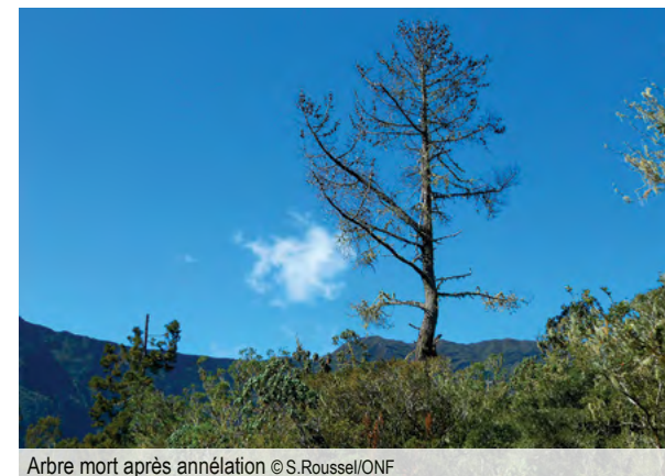
Arbre mort après annélation