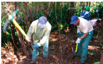
Arrachage des rhizomes à la pioche