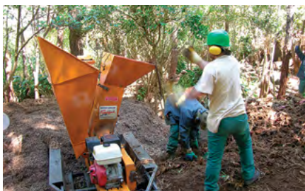
Broyage des rhizomes