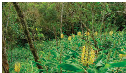
Invasion en sous-bois de forêt indigène

Plantes herbacées de la famille du Gingembre pouvant atteindre plus de 2 m de haut. Envahissent le sous-bois des forêts humides de manière spectaculaire. Dans les zones où elles dominent le sous-bois, elles empêchent ou limitent la germination et le développement des espèces indigènes. Si le Longose se développe préférentiellement à l'ombre, on observe qu'il se maintient également lorsque le couvert forestier est rompu.