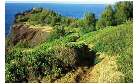
Filaos à Grande Anse avant lutte