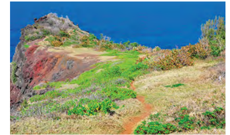
Après action de lutte