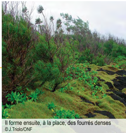
Il forme ensuite, à la place, des fourrés denses