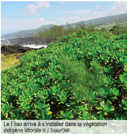
Le Filao arrive à s'installer dans la végétation indigène littorale

Arbre abondamment planté sur le littoral en raison de sa capacité à résister aux embruns, à la sécheresse et sa croissance rapide. Très bon bois de chauffage. Très recherché à La Réunion pour les cérémonies indiennes ( marches sur le feu ). Est devenu envahissant dans la région littorale humide ( Sud-Est : St-Philippe et Ste-Rose ) où il se développe sur des formations végétales littorales indigènes préservées et les coulées de laves récentes. En zone humide, il se régénère abondamment et rejette de souche, tandis que dans la zone sèche, il ne régénère pas et ne rejette pratiquement pas. A noter enfin que dans la zone sèche, on observe actuellement une mortalité très élevée des jeunes arbres plantés.