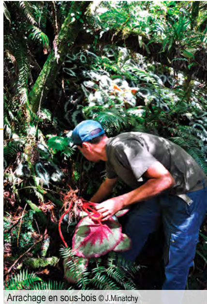
Arrachage en sous-bois