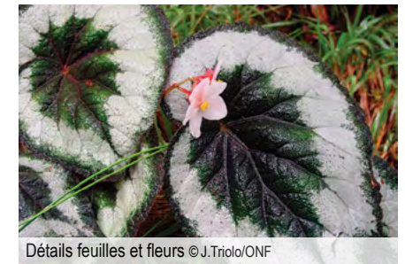
Détails feuilles et fleurs