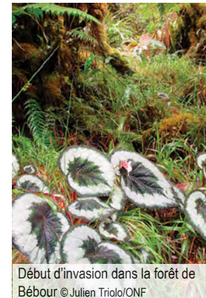
Début d'invasion dans la forêt de Bébour