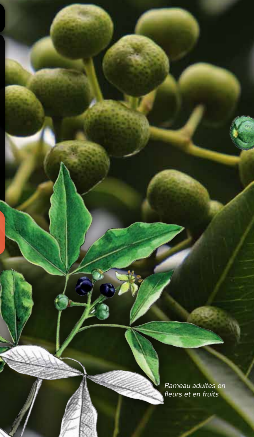
Rameau adultes en fleurs et en fruits