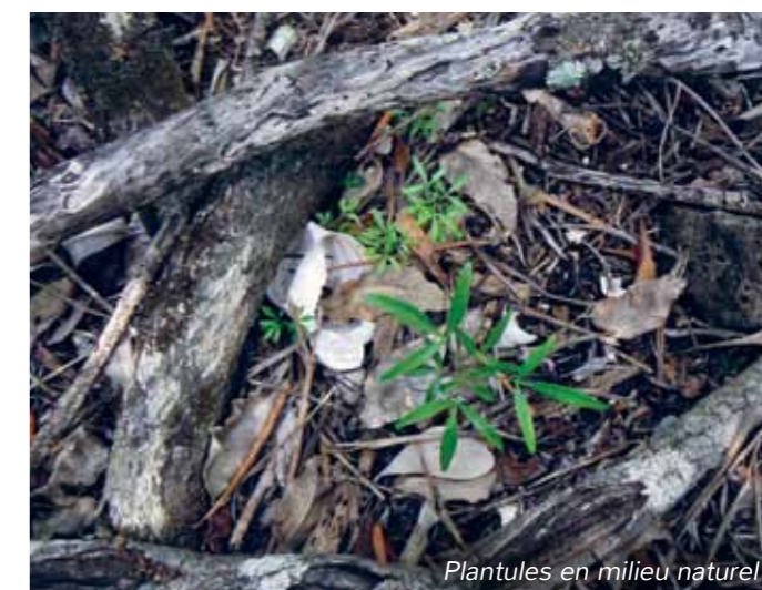
Plantules en milieu naturel

Croissance moyenne 1 an après plantation : 22 cm en hauteur et 10 cm au niveau de la couronne.