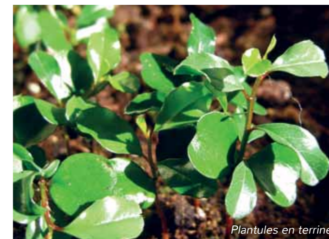
Plantules en terre