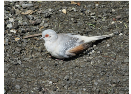
Tourterelle pays ( Geopelia striata )