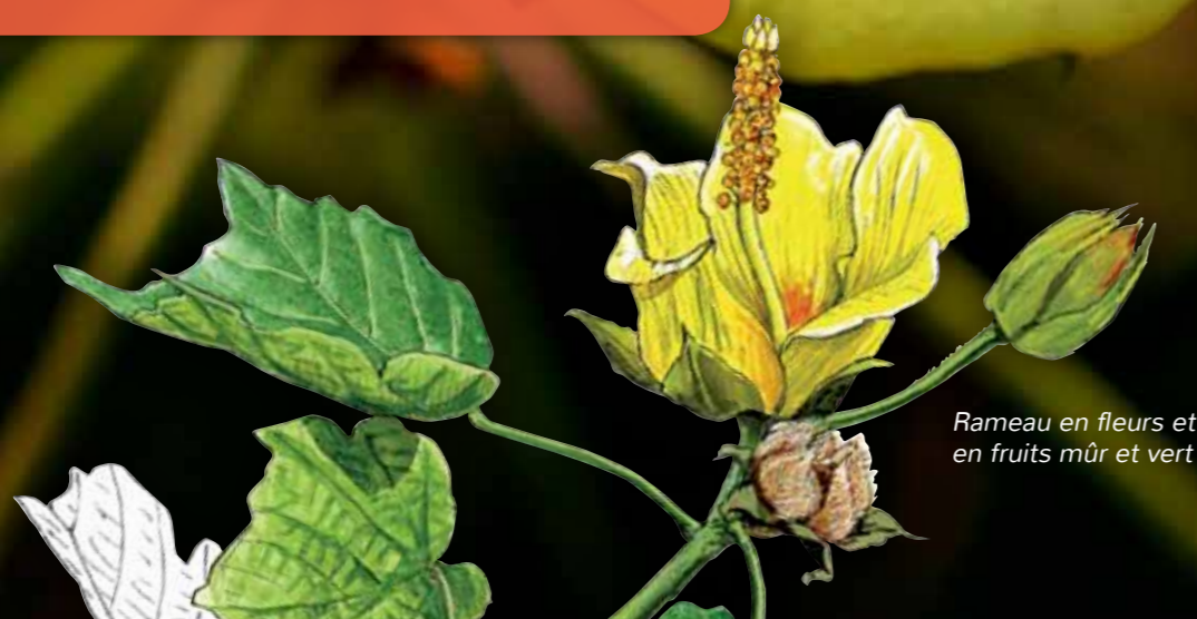
Rameau en fleurs et en fruits mûr et vert

Endémique de La Réunion et Maurice ; classée en danger critique d'extinction (CR) et protégée.